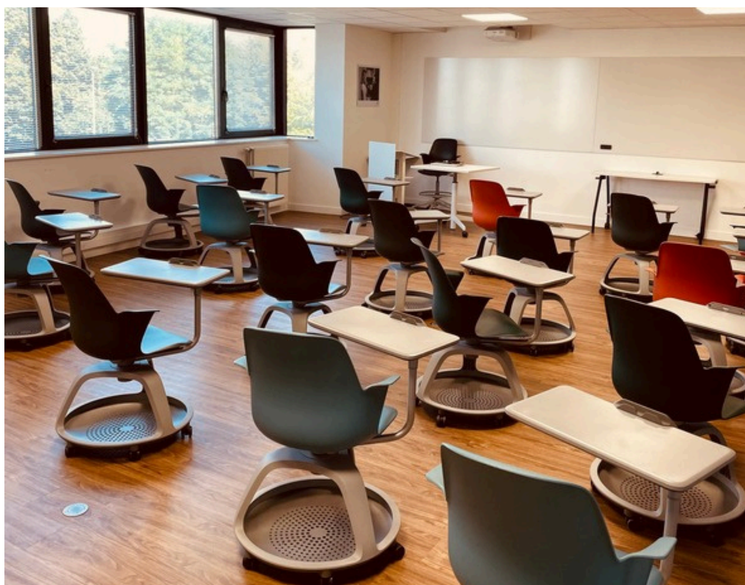
SALLES DE FORMATION