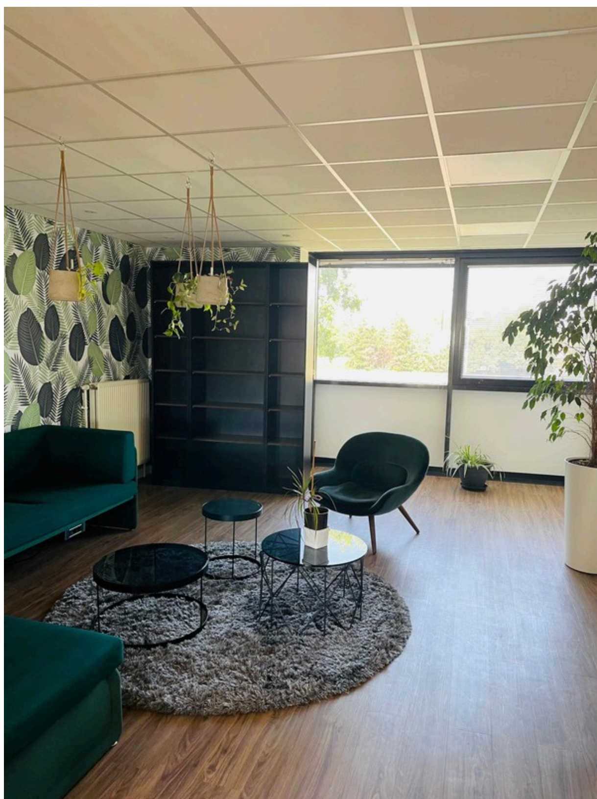
ESPACE DÉTENTE CFA VILLENEUVE D'ASCQ