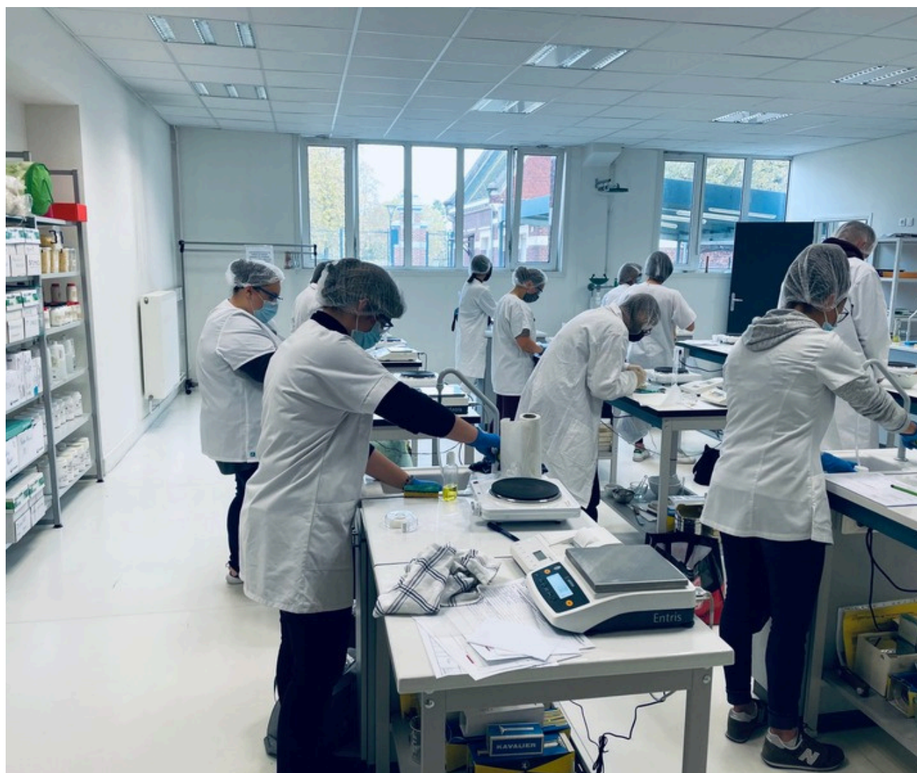
AU LABORATOIRE CFA DE VALENCIENNES