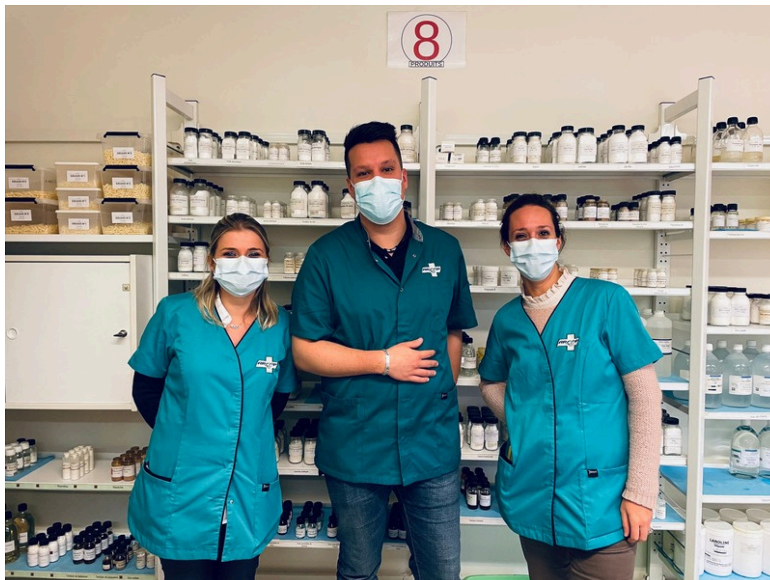
PROFESSIONNELS FORMATEURS EN TRAVAUX PRATIQUES